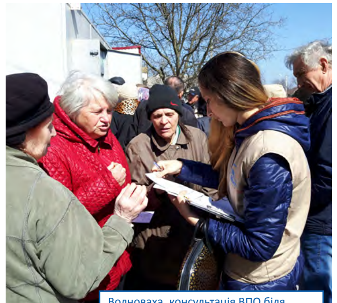
Волноваха, консультація ВПО біля мобільного відділення «Ощадбанку»

Завдяки Українському Фонду Соціальних Інвестицій (УФСІ) ВПО в Запорізькій, Харківській та Дніпропетровській областях мають нові можливості для заселення. Так, МКП у м. Вільногірськ, Дніпропетровської області (на 120 осіб), реконструкція якого фінансувалась УФСІ, був нещодавно заселений ВПО. Наразі в МКП мешкає вже 36 ВПО. У Мелітополі два МКП для ВПО вже були відкриті. Також планується відкрити МКП у Лозовій Харківської області. УФСІ відновлює приміщення для МКП у Мелітополі й Токмаку Запорізької області, Ізюмі, Краснограді Богодухові, Золочеві та Дергачі Харківської області.