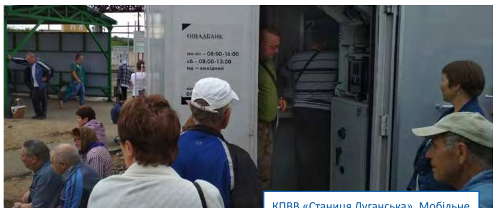
КПВВ «Станиця Луганська». Мобільне відділення «Ощадбанку»

його відсутність. Державна міграційна служба (ДМС) у м. Харкові продовжує відхиляти заяви ВПО на отримання паспортів та переправляє переселенців до ДМС в областях реєстрації їхнього місця проживання (контрольована Урядом України територія (КУУТ) Луганської та Донецької областей). Через ці труднощі деякі жителі неконтрольованої Урядом України території (НКУУТ) за допомогою третіх осіб намагаються вклеїти фотографію у паспорти, не відвідаючи контрольовану територію, що може призвести до отримання підроблених паспортів. Ці підроблені паспорти виявляються та конфіскуються на КПВВ. Загальний брак обізнаності та додаткові заплутані вимоги перешкоджають дітям отримувати статус дитини, яка постраждала внаслідок воєнних дій та збройних конфліктів.