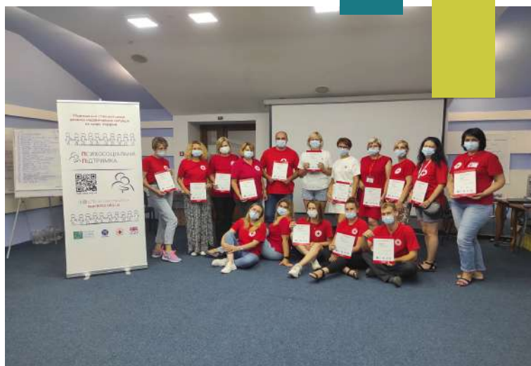
Фахівці ТЧХУ проводять тренінг з надання першої психологічної допомоги

Крім того, важливим компонентом зниження ризику виникнення надзвичайних ситуацій є безпечне і комфортне середовище, в якому відбувається навчання і спілкування з місцевим населенням. Одним з об'єктів, на якому будуть проходити подібні заходи, стане навчальний центр в м. Маріуполь, будівництво якого уже розпочалось в рамках проекту.